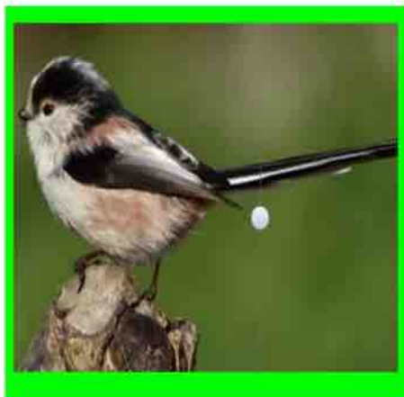
Mésange à longue queue.