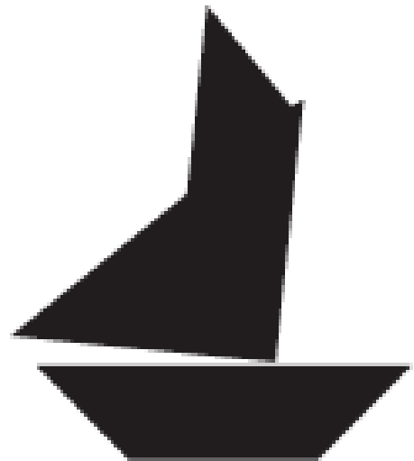
bateau à voile 2