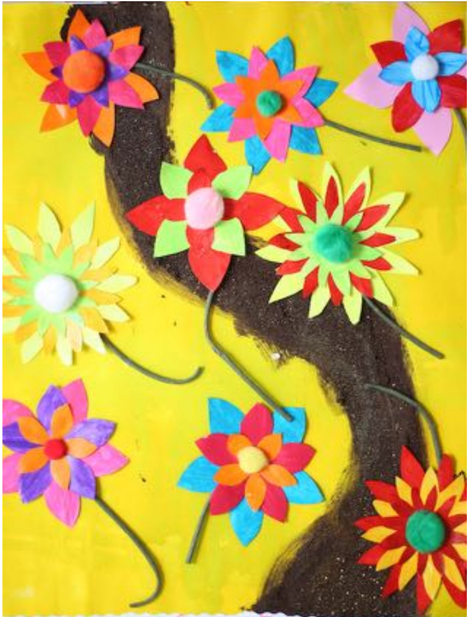
neuf fleurs dans le bouquet du petit chapeau rouge